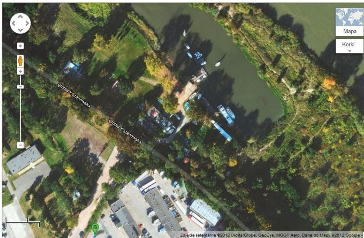
Rysunek 2 rzut na zatokę i ośrodek „Zatoka”. Od punktu B, znajdującego się na dole strony, idziemy prosto w kierunku łódek widocznych na zatoce (przecinając groblę Kozanowską ;) )