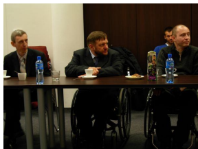
Niepełnosprawni dyskutują o stadionie

152 specjalne miejsca dla niepełnosprawnych będzie miał stadion na Piłkzyczach. Projektanci radzą się ich, jak wykonać odpowiednie ułatwienia, żeby później nie przebudowywać sportowej areny.